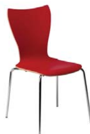
1743 A : 16" C : 17 1/2" E : 17 1/2"