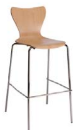
1783 A : 14 1/2" C : 29 1/2" E : 12"