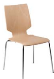
1741 A : 16" C : 17 1/2" E : 17 1/2"