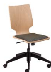
1761 A : 16" C : 15 - 20" E : 17 1/2"