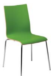
1742 A : 16" C : 17 1/2" E : 17 1/2"