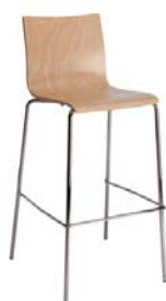
1782 A : 14 1/2" C : 29 1/2" E : 12"