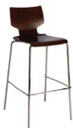
1781 A : 14 1/2" C : 29 1/2" E : 12"