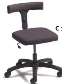
1502 A : 17" C : 16 1/2 - 21" E : 3 1/2 "