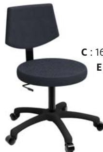
1507 A : 17" C : 16 1/2 - 21" E : 10 1/2 "