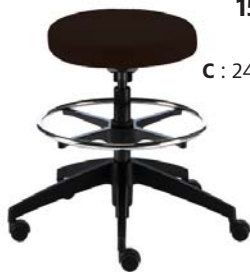
1500 DSN A : 17" C : 24 1/2 " - 34 1/2 "