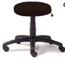
1500 A : 17" C : 16 1/2 - 21"