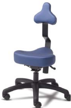
MED A : 15" C : 17" - 22" E : 8 1/2 "