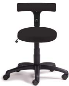
Q1500 A : 17" C : 16 1/2 - 21" E : 3 1/2 "