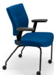
L9001 PR A : 20 1/2" C : 18" E : 17"