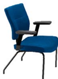
L9001 P A : 20 1/2" C : 18" E : 17"