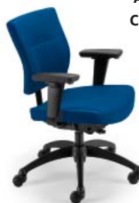
L9001 A : 20 1/2" C : 17 - 21" E : 17"