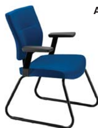
L9001 T A : 20 1/2" C : 18" E : 17"