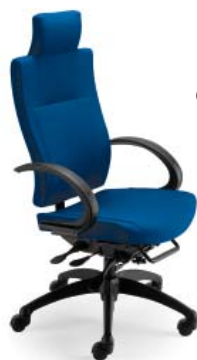
L9003 A : 20 1/2" C : 17 - 21" E : 29"