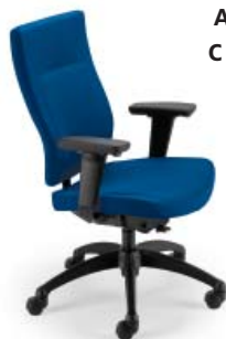
L9002 A : 20 1/2" C : 17 - 21" E : 23"