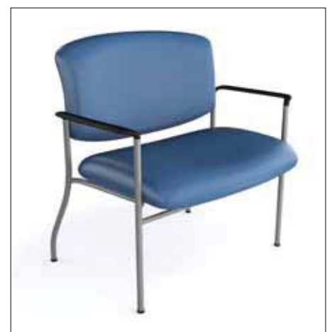
Fauteuil Bariatrique d'Invité rembourré 30 pouces Poids maximal 750 lbs avec bras