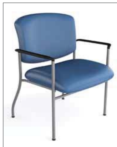
Fauteuil Bariatrique d'Invité rembourré 24 pouces Poids maximal 450 lbs avec bras