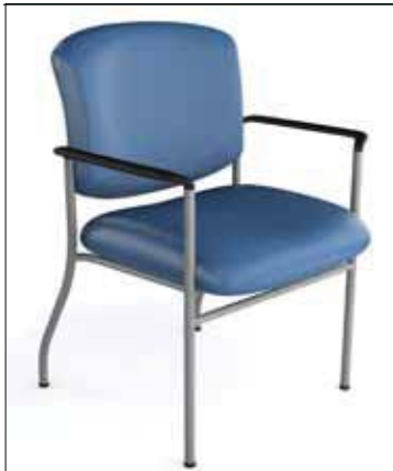
Fauteuil Bariatrique d'Invité rembourré 21 pouces Poids maximal 350 lbs. avec bras