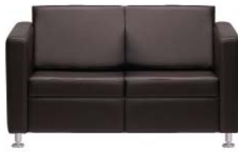
2002 A : 53" C : 18" E : 17"