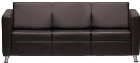
2003 A : 75" C : 18" E : 17"