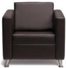
2001 A : 31" C : 18" E : 17"