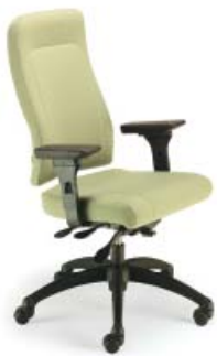
8002 A : 20" C : 17 - 21" E : 24"