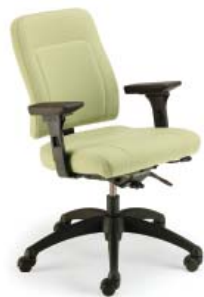
8001 A : 20" C : 17 - 21" E : 18 1/2"