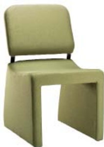
8000 A : 20" C : 19" E : 17"