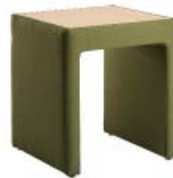
8000 T A : 17" C : 18 1/2"