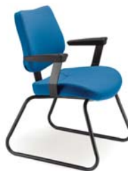
4001 T A : 20" C : 17 1/2" E : 15"