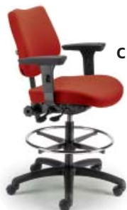
4001 DSN A : 20" C : 24 1/2 - 34 1/2" E : 15"