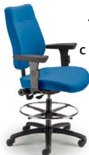
4002 DSN A : 20" C : 24 1/2 - 34 1/2" E : 19"