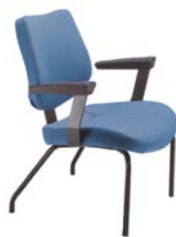
4001 P A : 20" C : 18" E : 15"