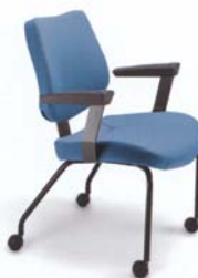
4001 PR A : 20" C : 18" E : 15"